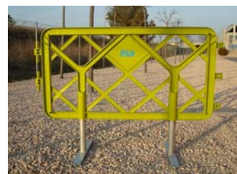
Valla con pies metálicos