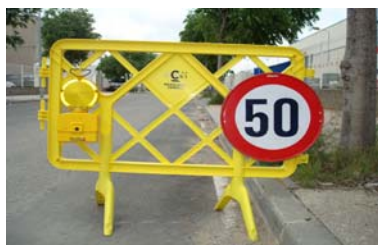
Valla serigrafiada con pie de plástico. No incluye señal ni baliza